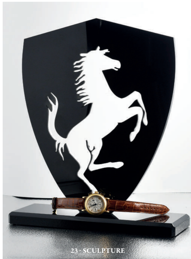
23 - SCULPTURE