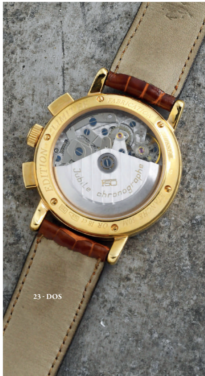
23 - DOS

ÉCRIN EN PLEXIGLASS INTÉGRANT LA MONTRE et livrée avec une sculpture du mythique cheval cabré de la Scuderia Ferrari également en plexiglas de 40 cm, réalisé à cette occasion à 50 exemplaires.