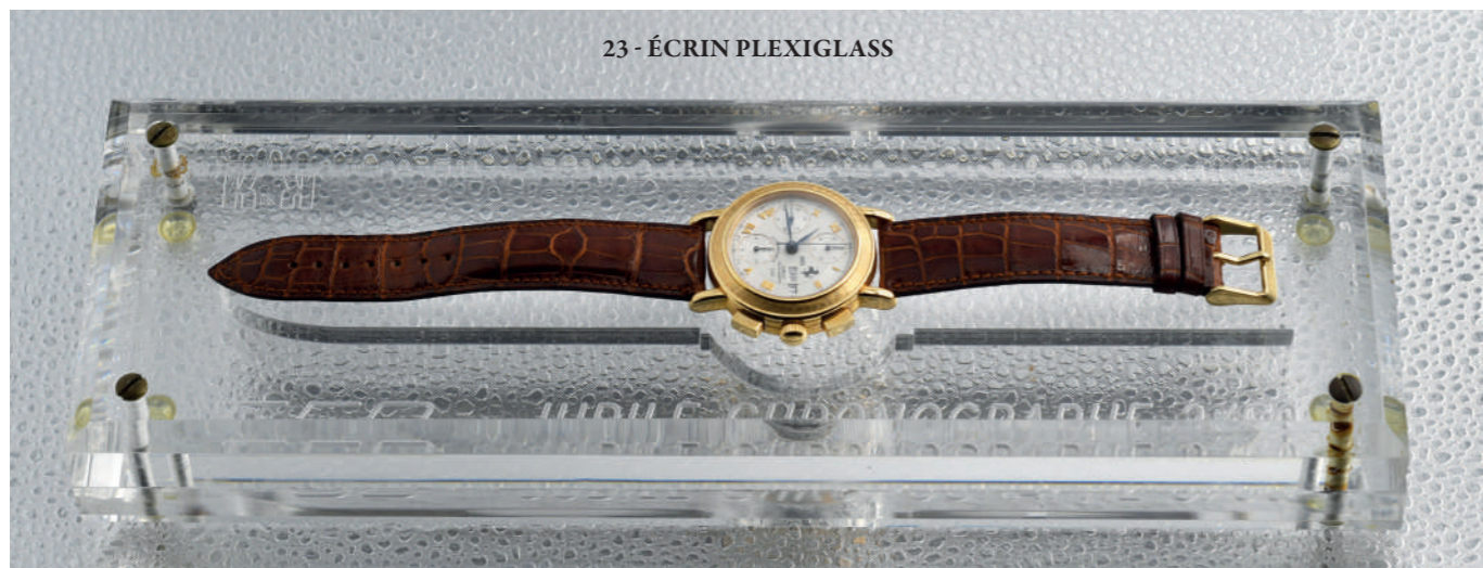
23 - ÉCRIN PLEXIGLASS

ÉCRIN EN PLEXIGLASS INTÉGRANT LA MONTRE et livrée avec une sculpture du mythique cheval cabré de la Scuderia Ferrari également en plexiglas de 40 cm, réalisé à cette occasion à 50 exemplaires.