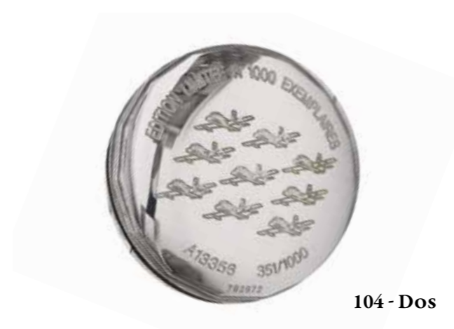
104 - Dos