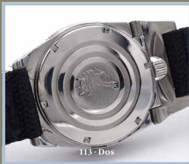
113 - Dos

Mythique montre de plongeur Triton fabriquée pour le « Comptoir Commercial de Manufacture » au début des années 1960 (fabriquant aussi le célèbre chronographe de pilote Chronofixe Type 20). Monsieur Parmentier, qui en était le dirigeant, a conçu la Triton pour la marque Spirotechnique et l'inclure à son catalogue en 1963. Principalement destinée aux nageurs professionnels et militaires, on retrouve cette montre au poignet de certains membres de l'équipe Cousteau et des nageurs de combat Français et Américains. La montre a été fabriquée et assemblée à Besançon par la maison Dodane entre 1963 et 1964. Cette pièce mythique vient d'être rééditée par la maque Triton et une série hommage vintage sera dévoilée d'ici la fin de l'année.