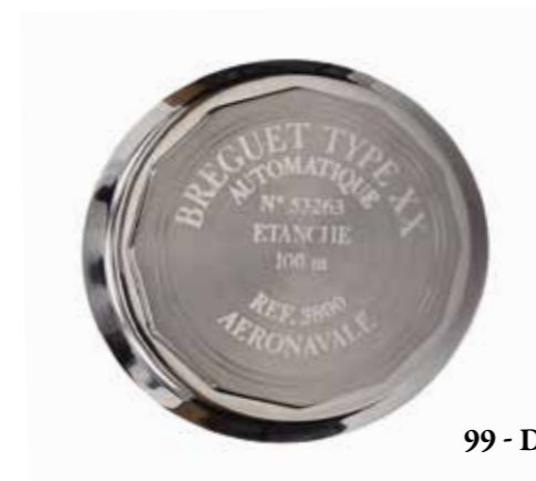
99 - Dos

DIMANCHE 20 OCTOBRE 2024 2 DE PARTIE DE LA VENTE