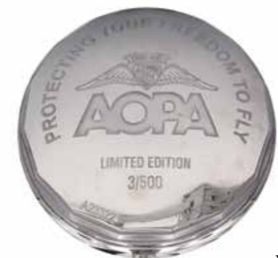
105 - Dos