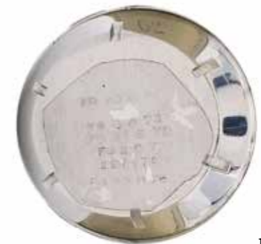
106 - Dos