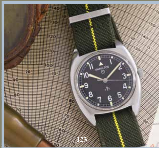
123 - HAMILTON DOTATION / ROYAL AIR FORCE - RÉF. 10793/73, VERS 1973 Montre d'aviateur réglementaire en dotation dans l'armée Anglaise (marquage à 6 h Broad Arrow et attaches fixes). Boitier en acier brossé de forme tonneau à fond monobloc (signé des marquages réglementaires). Cadran noir avec chiffres arabes peints, chemin de fer, index pastille et aiguilles glaive luminescents. Modèle grande trotteuse centrale. Bracelet tissu style Nato. Mouvement : Calibre mécanique remontage manuel Hamilton / 821 Swiss. Dimensions : 41 x 36 mm État : Bon état (Prévoir léger entretien)