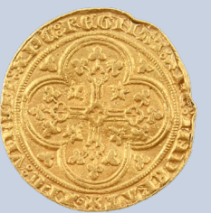
58 Philippe VI de Valois ; Ecu d'or à la chaise, or, diam 28 mm ; monnaie TTB, frappée sur un flan court, chocs importants à 3h et 5h, enfonceur au centre de la monnaie. Poids : 4,4 g