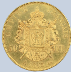
55 Napoléon III 50 francs 1855, tête nue. Atelier Paris. Poids : 16,2 g