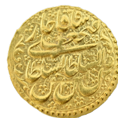
70 Fath Ali Shah (1212-1250) - Toman - 1232. Atelier Yazd - or, état TTB. Poids : 4,5 g