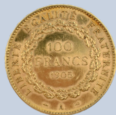
60 100 francs 1905, marqué A. Poids : 32,3 g