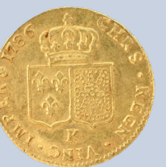
59 Double Louis d'or Louis XVI «K» Bordeaux 1786. Etat : TTB / TTB+ Poids : 15,3 g